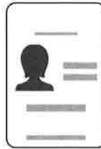
Tarjeta de Identificación Personal de Texas*