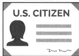
Certificado de Ciudadanía de EE.UU. con Fotografía