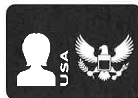
Pasaporte de EE.UU. (Libro o Tarjeta)*