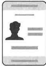
Certificado de Identificación Electoral de Texas*