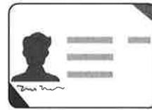
Licencia para Portar Armas de Fuego en Texas*